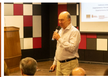
Conferencia Internacional Sobre Resiliencia Frente Al Acoso Escolar: Factores Psicosociales E Intervención Neurocognitiva