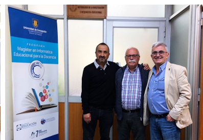
Investigadores españoles de la Universidad de Cádiz colaboran en proyecto Internacional sobre habilidades matemáticas en niños y niñas